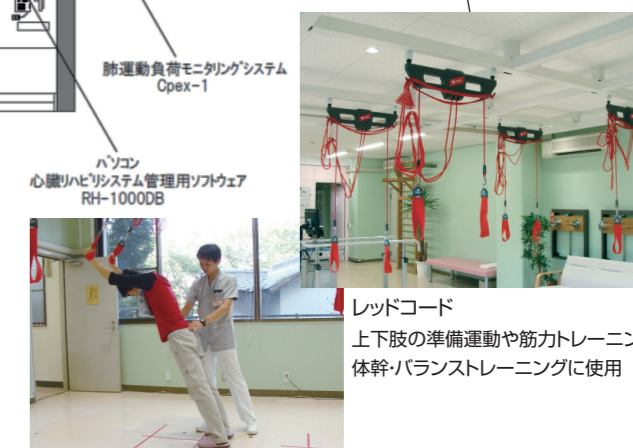
レッドコード 上下肢の準備運動や筋カトレーニング、 体幹・バランストレーニングに使用